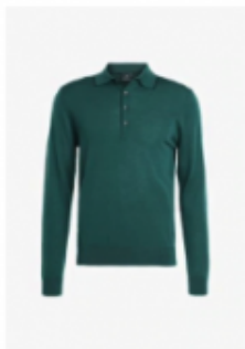
Strickpullover PS by Paul Smith