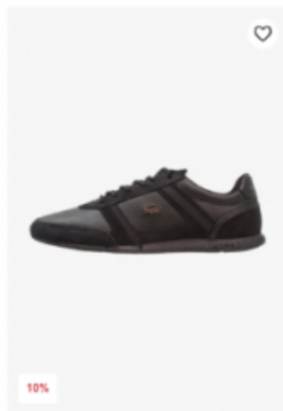
10% ab 116,95 € ab-129,90 € Sneaker low Lacoste