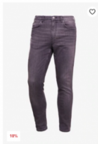
10% ab 107,95 € ab-119,90 € Jeans Slim Fit HUGO