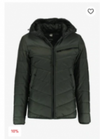
10% ab 134,95 € ab-149,90 € Übergangsjacke G-Star

Sowohl die Outfits der Stylisten, als auch die des AFC, wurden von jeweils etwa 50 Prozent der Befragten als "gut" befunden.